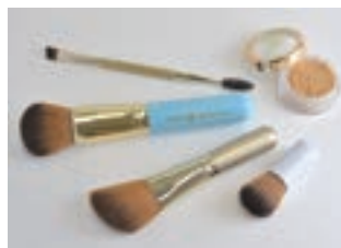
株主優待品 (100株以上500株未満) 10,000円相当の自社商品 化粧品「オンリーミネラルセット」