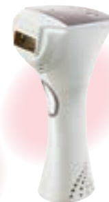
レイボーテ フォーメン