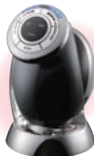
RFボーテ キャピスパ

ゆとりをもたらす時短家電や、かしく節電する省エネ家電を家電のプロが厳選する「スマート家電グランプリ」において、「スマート家電グランプリ2015」健康・理美容家電部門から、『RFボーテ キャピスパ』、『プラチナホワイト RF』、『レイボーテ フォーメン』が金賞を受賞しました。