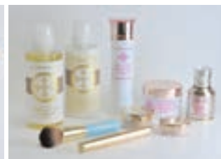
株主優待品 (500株以上) 30,000円相当の自社商品 化粧品「オンリーミネラルセット」