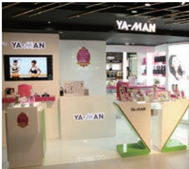
2014年11月8日、香港大手百貨店「SOGO尖沙咀(Tsim Sha Tsui/チムサーチョイ)店」に当社専用ブースがオープンしました。

大手家電量販店向け卸売事業において直接取引への切り替えが順調に進み、店舗数も拡大して安定的な売上を確保できる体制が構築されてきたこと、個人顧客向け直販事業において費用対効果を重視した広告宣伝費の投下を徹底したことなどの企業努力が奏功した反面、このところの急激な円安による輸入コストの増加を吸収するには至らず、当第2四半期連結累計期間における売上高は6,372,491千円(前年同四半期比13.7%減)、経常利益は31,014千円(前年同四半期は221,254千円の損失)、四半期純利益は17,686千円(前年同四半期は140,841千円の損失)となりました。